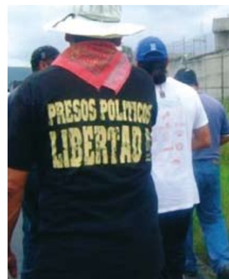
Protestas a las afueras del Penal de Molino de Las Flores

La campaña antirrepresiva de la CGT no se detiene. Atenco tampoco. Los puentes de entendimiento, conocimiento recíproco y trabajo común desde un lado al otro del océano y viceversa, van en aumento. Será que el sueño va a lomos de un caracol. El sueño va, con grandes dosis de cotidianeidad.