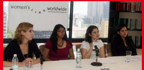
Coordinación Internacional Contra la tortura sexual

para que investigara el crimen de tortura. En caso contrario, se interpondría un recurso de amparo ante el Tribunal Constitucional por vulneración del derecho a la tutela judicial efectiva.