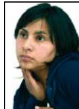
América Del Valle Frente de Pueblos en Defensa de la Tierra 15 de septiembre, 2008.

Tenemos enfrente una batalla que no será de corto plazo, pero tampoco va a durar el siglo o los 32 años que decretaron contra nuestros hermanos. Es una lucha larga que implicara no bajar la guardia por ningún motivo; una lucha que necesitará consolidar y reforzar aún más la solidaridad con el pueblo mexicano e internacional, con las organizaciones, los defensores de los derechos humanos, con los maestros, los obreros, los estudiantes, los campesinos, los indígenas, las amas de casa.