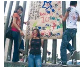
Niñas y Niños de La Otra Campaña en el DF

Las mantas, los carteles, quedaron como testimonio fiel, y con mucho corazón, de que a los niños, niñas y jóvenes en México les indigna la injusticia.